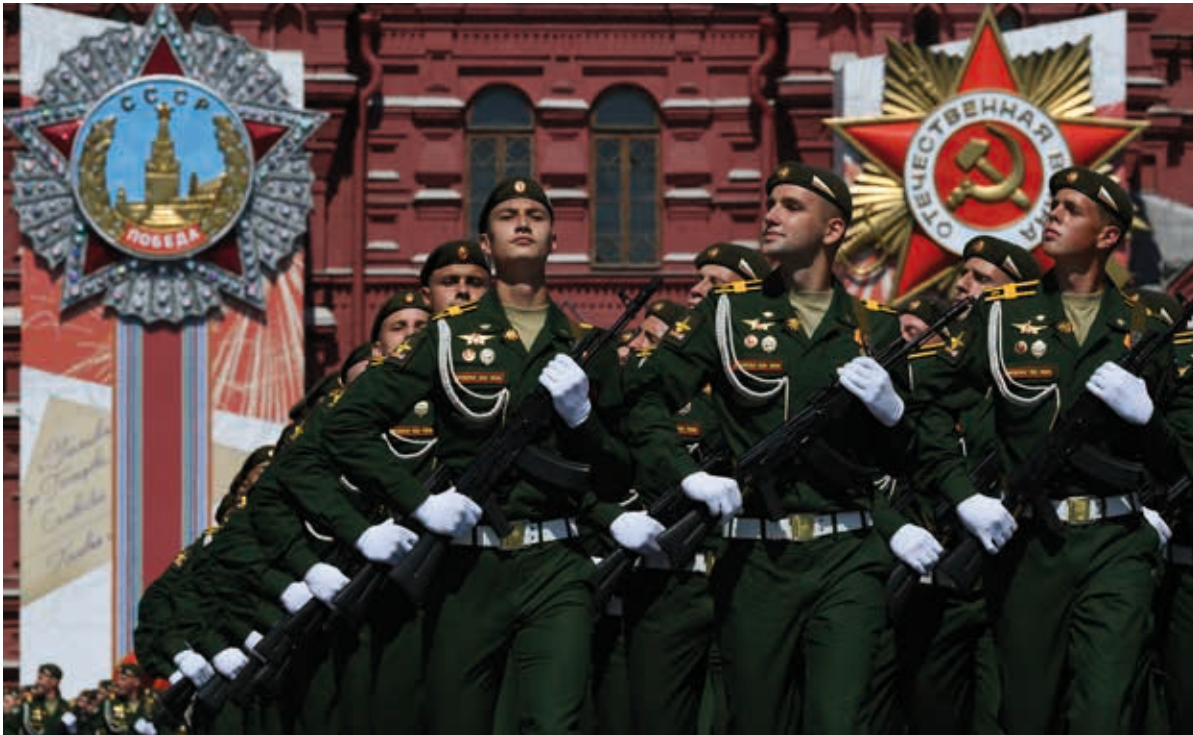
Défilé militaire organisé sur la Place Rouge à Moscou le 9 mai 2021. Malgré la propagation rapide du nouveau coronavirus (Covid-19), le Kremlin a maintenu les célébrations prévues pour célébrer le 75e anniversaire de la Victoire dans la Seconde guerre mondiale.