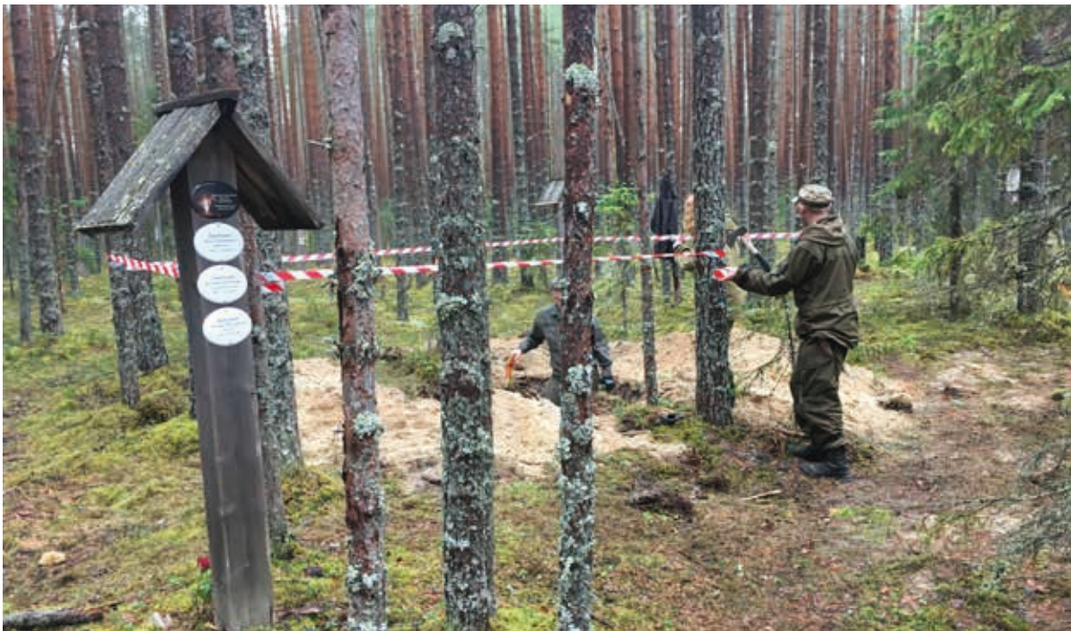
Chercheurs de la Société russe d'histoire militaire procédant aux fouilles sur le site de Sandarmokh, lieux d'exécutions de masse à l'époque de la Grande Terreur. Crédit photographique : Sergueï Markelov, fin août 2018