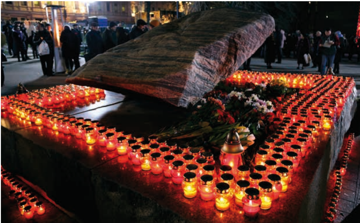
Le monument sur la Place Loubianka, pendant la cérémonie « Retour des noms » organisée récemment