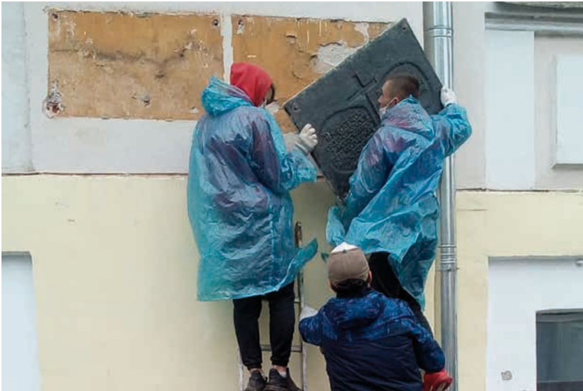
La dépose des plaques commémoratives en hommage aux victimes de la Grande Terreur et du massacre de Katyń à Tver, en mai 2020.