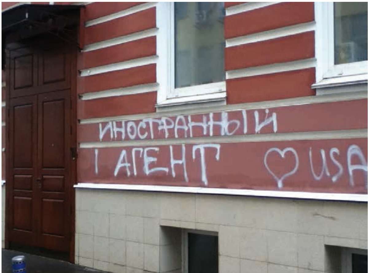
Les mots peints à la bombe « Agent étranger ! ♥ USA » sur la façade de l'immeuble de bureaux de Memorial International.