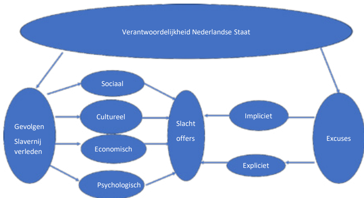
Figure 1: Gevolgde methode

Voor het bepalen van een visie in deze vanuit een wetenschappelijke context zal de volgende gedachtegang gevolgd worden. Allereerst zal kort uiteen gezet worden wat de gevolgen van het slavernijverleden waren op sociaal, economisch en cultureel gebied voorde gemeenschappen van de Nederlandse Caribische eilanden. Daarna zal toegelicht worden wat de betekenis van excuses aanbieden is en wat de impact kan zijn op slachtoffers, de Nederlandse staat en andere belanghebbenden. De vraag zal ook beantwoord moeten worden in hoeverre de Nederlandse Staat hiervoor verantwoordelijk was of niet. Tot slot zal gekeken worden naar vormen van excuses. Indien deze aangeboden worden, zal dit leiden tot een betere verstandhouding tussen de gemeenschappen in het Caribisch gebied en de Nederlandse Staat. De gevolgde methodiek wordt hieronder grafisch weergegeven.