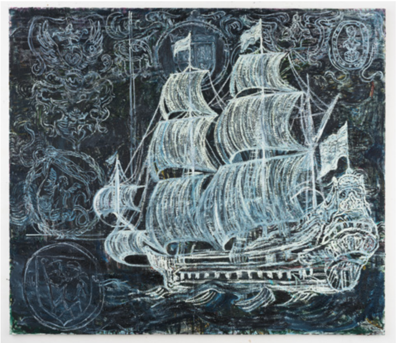
Natasja Kensmil | White Elephant, 2019 | Collectie Amsterdam Museum

Neem om het onderwijs te versterken maatregelen om ervoor te zorgen dat de onderwerpen slavernijverleden en de doorwerking daarvan in het heden een vast onderdeel worden van het curriculum in alle onderwijsniveaus en vooral ook in de pedagogische opleidingen.