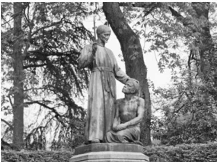
Standbeeld Peerke Donders in Tilburg

Peerke Donders (1809-1887) was een missionaris in Suriname tijdens en vlak na de slavernij. Donders is ook bekend als de 'Apostel der Melaatsen en Indianen' omdat hij zich in Suriname als een van de weinigen ontfermde over de melaatsen, en daarmee een groot risico nam voor zijn eigen gezondheid. Zijn handelen was ingegeven door zijn overtuiging van radicale gelijkwaardigheid. In Suriname wordt hij tot op de dag van vandaag geëerd vanwege zijn onzelfzuchtige inzet. In 1982 werd hij door Paus Johannes Paulus II zalig verklaard.